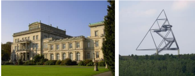
Villa Hügel, Tetraeder Halde Beckstraße

- Gemeinsames Abendessen, geplant als Biergartenbesuch und Treff mit dem DGGL Ruhrgebiet –