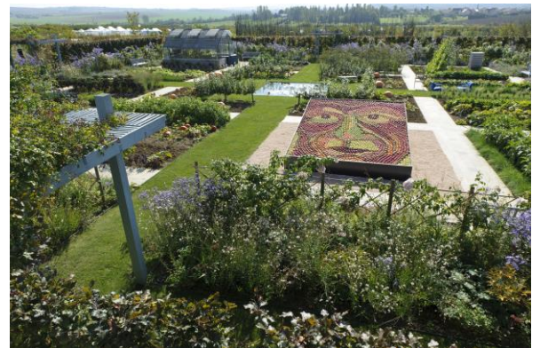
Jean-Claude Kanny – Moselle Tourisme

An den Ufern der Nied liegt das nüchterne und zugleich elegante Schloss Pange. Es wurde im Jahre 1720 von Jean-Baptiste Thomas, Marquis de Pange, an der Stelle einer alten Festung erbaut. Die Familie Pange wohnt heute noch in diesem Schloss, in dem Büsten, Gemälde und alte Stiche seine Geschichte in Erinnerung rufen. 2003 wurden die neuen Gärten eingeweiht, die von dem Landschaftsarchitekten Louis Benech im Rahmen des grenzüberschreitenden Netzes „Gärten ohne Grenzen“ entworfen wurden.