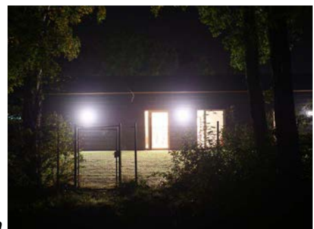
Kita am Abend in DEL, Hasberger Str.

Der Eintritt beträgt 5,00 € für DGGL-Mitglieder frei