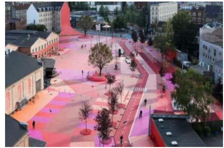
Der rote Platz, Kopenhagen