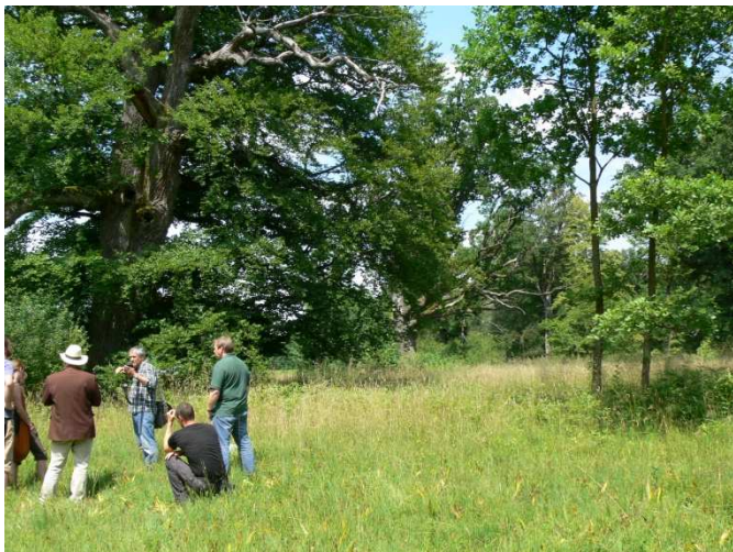
„METHUSALEMBÄUME“ UND IHRE BEDEUTUNG FÜR DEN ARTENSCHUTZ