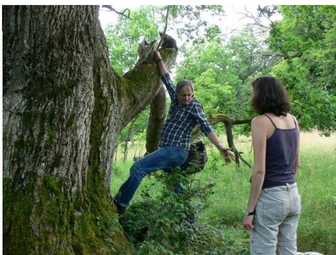
KLETTEREINSATZ ZUR UNTERSUCHUNG VON URWELT-RELIKT-ARTEN