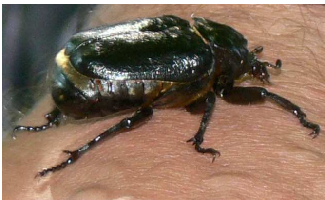
DER EREMIT - EINE STRENG GESCHÜTZTE ART, LEBT IM MULM ALTER EICHEN

Behördenvertreter, Landwirte, Landschaftsarchitekten, Tiefbau-Ingenieure, Architekten, Techniker, Gärtner und Personen, die im GaLaBau und im Unterhalt arbeiten, haben im Rahmen ihrer Tätigkeit bei der Bewirtschaftung, Planung und bei Baumaßnahmen mit alten Baumbeständen zu tun. Es ist festzustellen, dass deren wesentliche Rolle im Naturhaushalt, häufig nicht wirklich bekannt ist bzw. nicht ausreichend wert geschätzt und entsprechend geschützt werden.