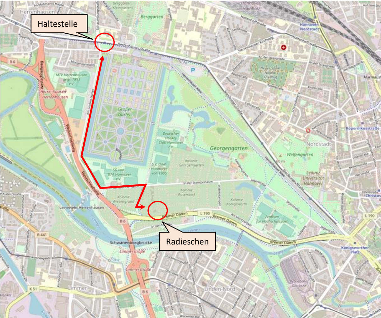
Kartengrundlage: © OpenStreetMap-Mitwirkende