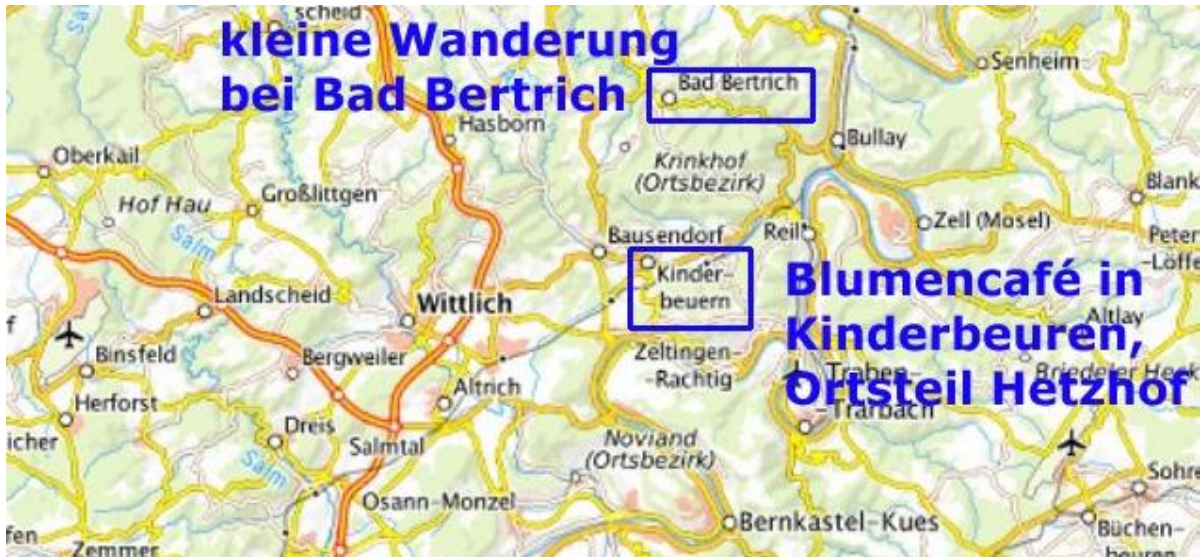
Übersicht: Lage Bad Bertrich und Kinderbeuern-Hetzhof