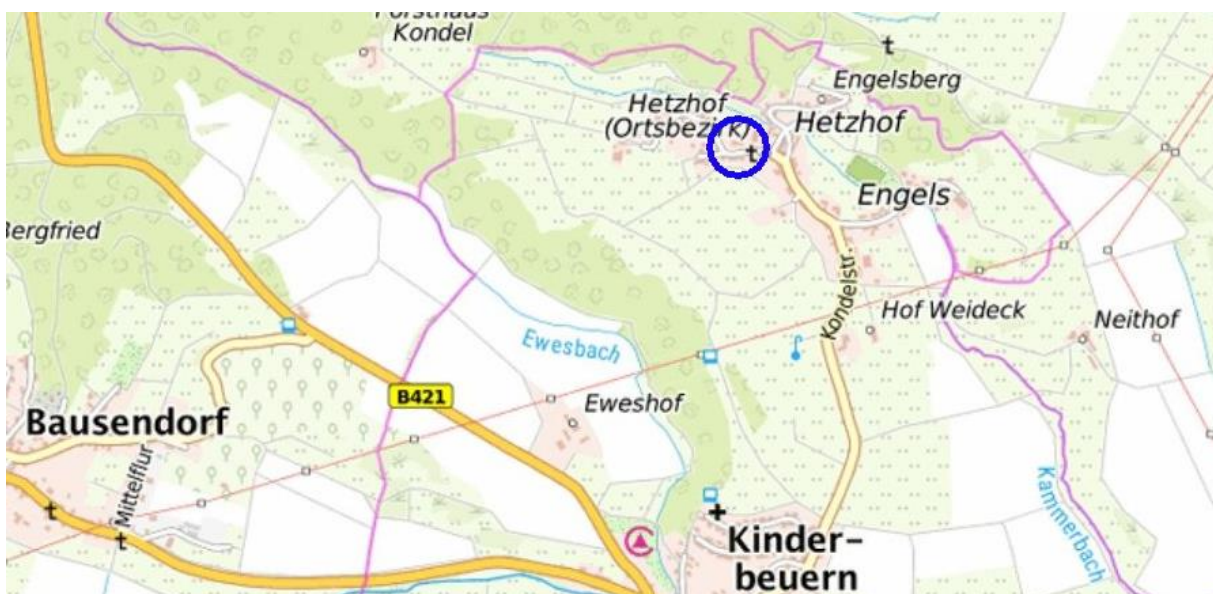
Treffpunkt 16. 15h: Blumencafé Landleben, Kondelstr. 30, 54538 Kinderbeuern-Hetzhof.