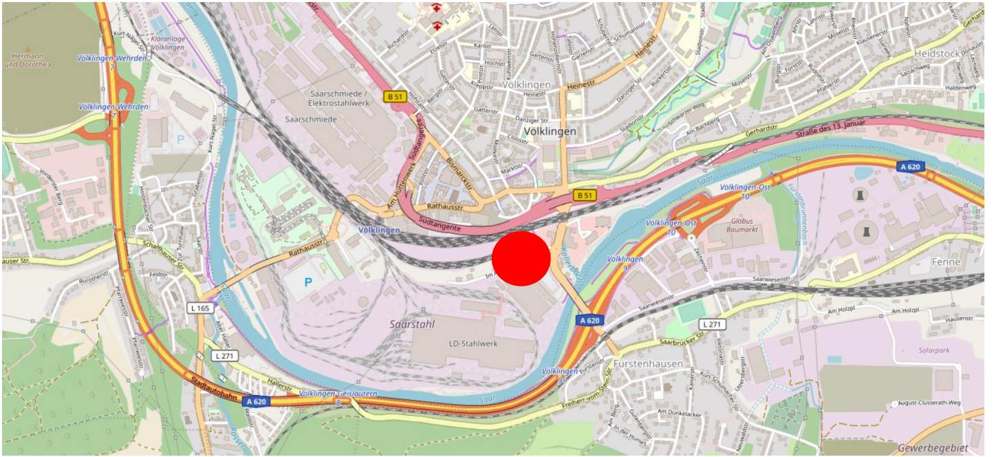
Karte hergestellt aus OpenStreetMap-Daten | Lizenz: Open Database License (ODbL)