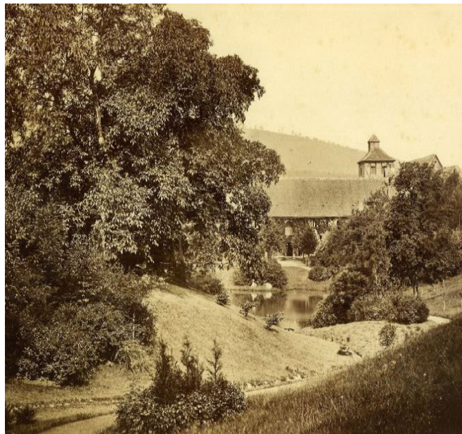
Blick über Mönchsgraben und Teich zu Kloster und Kirche, um 1890