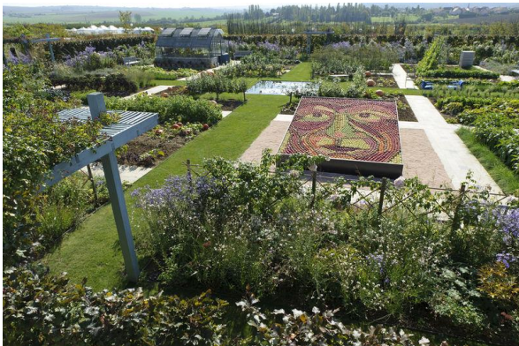
Jean-Claude Kanny – Moselle Tourisme

Der „Garten der Aromen“ zählt zu den „Gärten ohne Grenzen“. Der fast 4 Hektar große Obstgarten macht auf seinen Pfaden durch 14 Themenareale mit den verschiedenen Aromen vertraut. Ein Kräutergarten, der Garten der essbaren Blumen, der Gemüsegarten für Neugierige und sogar ein verbotener Garten, es ist für jeden etwas dabei.