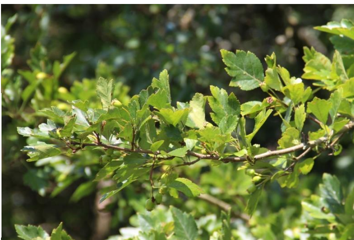
NOCH ZU BESTIMMENDER WEISSDORN