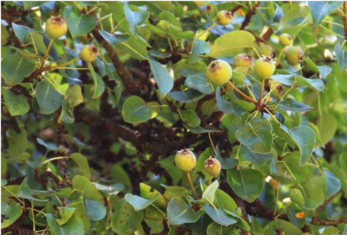
WILDE BIRNEN BEI MASSENDORF

TREFFPUNKT: PFLUGSMÜHLE IM WINTERGARTEN PFLUGSMÜHLE 1B, 91183 ABENBERG