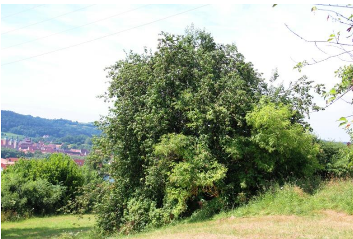
HISTORISCHE WILDOBSTHECKEN IM SPALTER HÜGELLAND