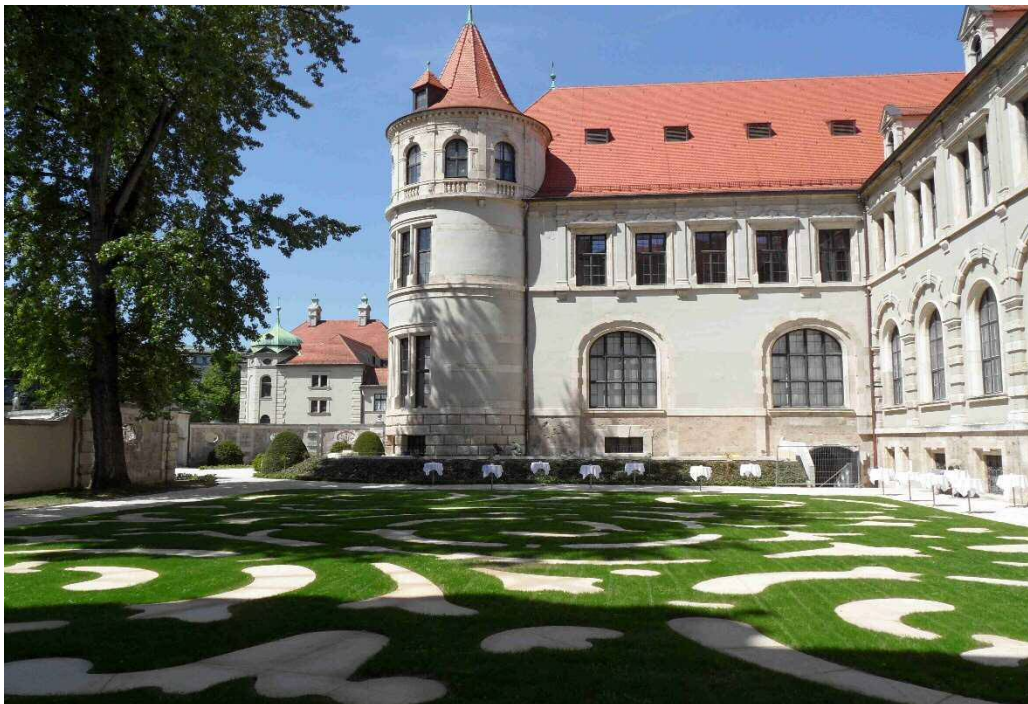
Bayerisches Nationalmuseum München - Innenhof

Wir führen Sie durch einen Teil der historischen Münchner Parks und Grünanlagen in der Innenstadt und treffen dabei auch auf neu gestaltete Plätze und moderne Freiräume. Unsere Route führt uns vom Alten Botanischen Garten über den Maximiliansplatz zum neu gestalteten Platz der Opfer des Nationalsozialismus. Von dort machen wir einen kleinen Abstecher zum Neuen Siemensforum und erreichen über den Odeonsplatz den Finanzgarten und schließlich den Hofgarten und Englischen Garten. Nach einer Mittagspause in der Goldenen Bar im Haus der Kunst geht es weiter zum Bayerischen Nationalmuseum (neu angelegter Innenhof und Platzfläche von Rainer Schmidt). Von dort folgen wir dem Eisbach auf die andere Seite der Prinzregentenstraße zu den von Peter Latz gestalteten Freianlagen am Alexander Wacker Haus.