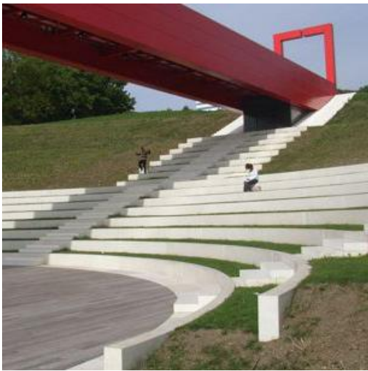
Axe majeur

Vor etwa 25 Jahren entdeckte die Landschaftsarchitektur die amerikanische Land Art als richtungsweisende Inspirationsquelle für die ästhetische anspruchsvolle Gestaltung von Gärten, Parks und Plätzen. Heute dominieren funktional geprägte Begriffe wie „grüne Infrastruktur“ die aktuellen Fachdebatten, und es scheint, als habe die Landschaftskunst als umweltgestalterisches Vorbild ausgedient - ganz sicher?