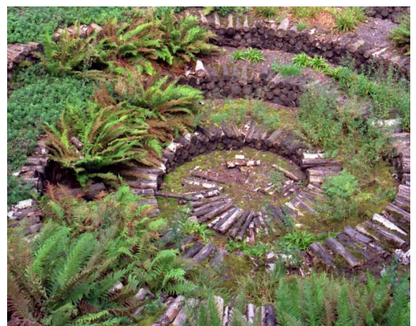
Farngarten im Erzbunker