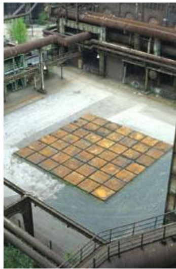
Piazza metallica