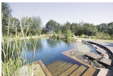
Schwimmteich mit Flachwasser