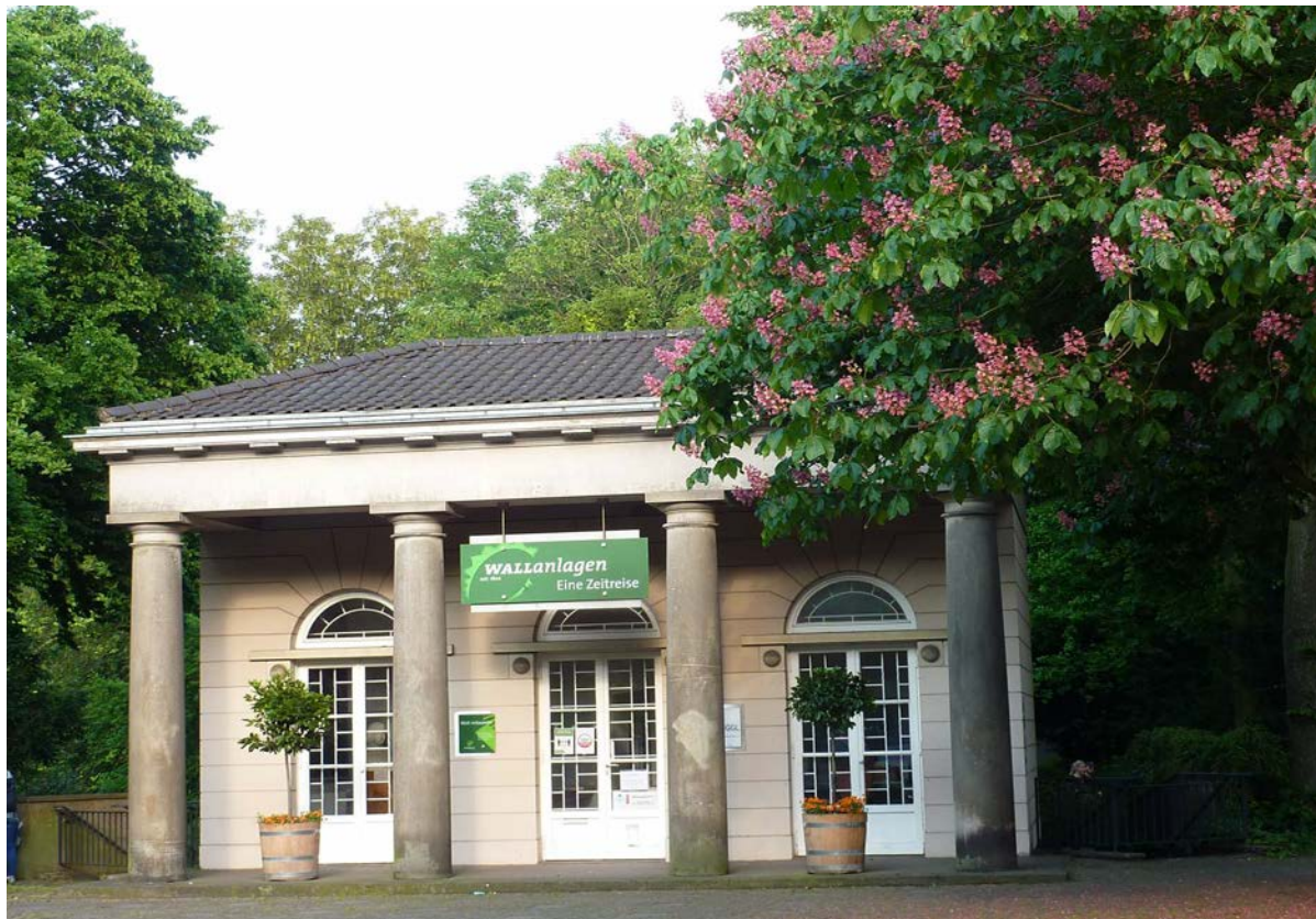
Das DGGL - INFO-CENTER im Ansgarii - Torhaus, Bgm.-Smidt-Str. 88, 28195 Bremen