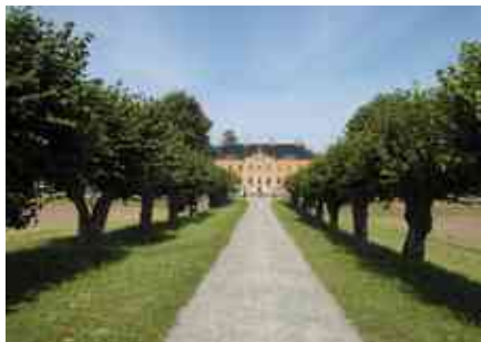
Feston-Allee in Klütz

Wir haben vor, in Schwerin den Schlossgarten, den Burggarten, das Schloss und die wunderschöne Altstadt, den Schlossgarten von Ludwigslust und den in Neustrelitz, Malchow, den Skywalk, die historische Welt des Schlossparks zu Putbus, die deutsche Alleenstraße und das Jagdschloss Granitz auf Rügen, dann Schloss Bothmer mit der einzigartigen Feston-Allee und die Gärtnerei in Klütz zu besuchen.