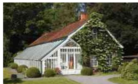
Orangerie in Hasses Park