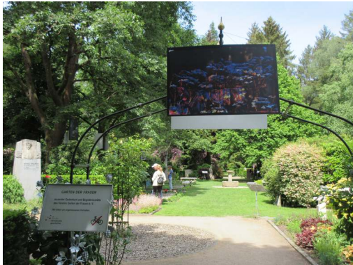
„Garten der Frauen“ HH-Oldsorf

Deutsche Gesellschaft für Gartenkunst und Landschaftskultur Lv. Br/NN e. V.