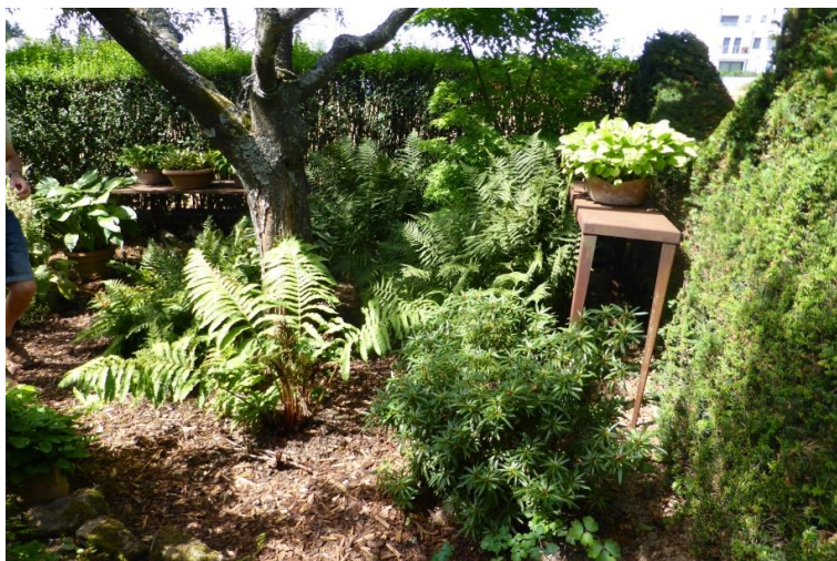
Schattenecke im Garten von Familie Folschette