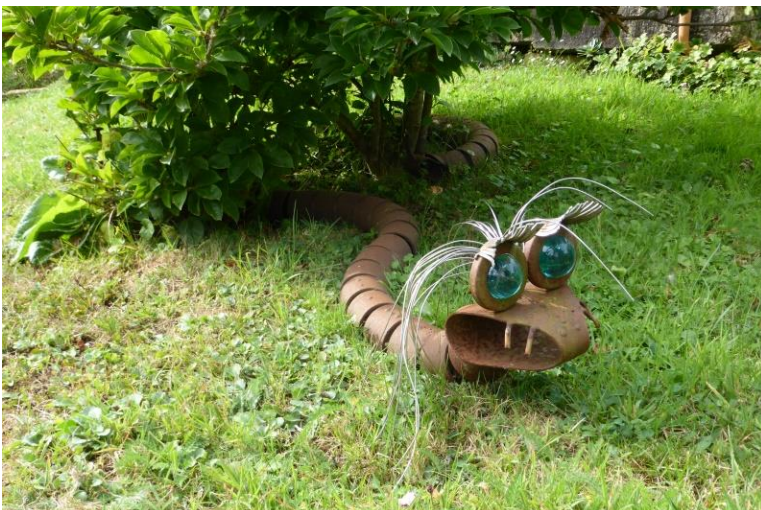
Bei Frau Schumacher – Putz entstand aus einem alten Obstgarten ein grünes Paradies