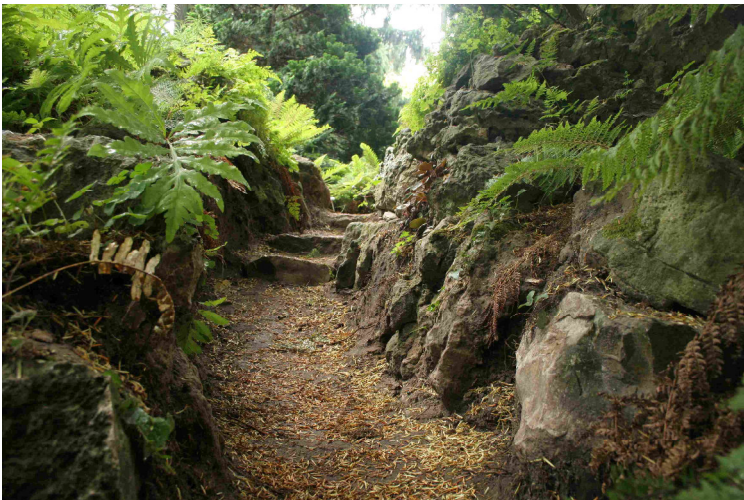
Histor. Pavillon (li. o.), Farnschlucht (u.), Zwerg-Pfauenradfarn ( Adiantum pedatum 'Imbricatum' (re.o.)); Bilder: Jochen Martz (2), Felicia Laue (1)

Die seit über 30 Jahren bestehende Sammlung ist größtenteils in die schattigen Steingartenpartien des historischen Gartens integriert und umfasst rund 300 verschiedene Arten, Sorten und Typen. Sie enthält in Mittelfranken winterharte Farne aus nahezu allen gemäßigten Zonen der Welt. Einen Schwerpunkt bilden auch historische, großteils britische Gartenformen, die in deutschen Gärten in dieser Vielfalt nur selten zu finden sind. Jochen Martz entführt persönlich in die faszinierende Vielfalt dieser Pflanzengruppe und gibt auch eine Einführung in die Geschichte und Typologie von Farnärten (Ferneries).