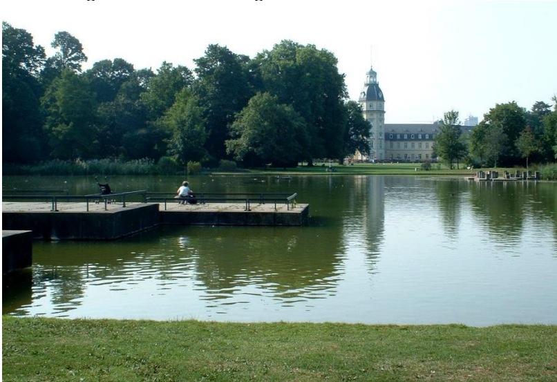
Landschaftlicher See, Parkanlage

Die Veranstaltung ist bei der Architektenkammer Baden-Württemberg als Fortbildung anerkannt. Wer Interesse an einer Bescheinigung für den Besuch der Veranstaltung hat, kann im Vorfeld bei der Anmeldung dieses mit Nennung der Adressdaten und der AKBW-Nummer mitteilen.