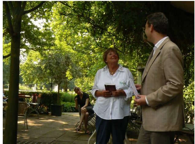
Gartenbesitzer und Mitglieder der DGGL bestaunen die gärtnerische Vielfalt Mittelfrankens