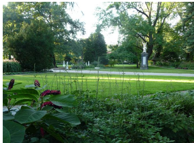
und erfreuen sich der schönen Atmosphäre des vielen noch unbekanntes Fürther Stadtparks.

Für die Vorstandschaft der DGGL Bayern - Nord e. V. gez. 19.7.2010 Felicia Laue