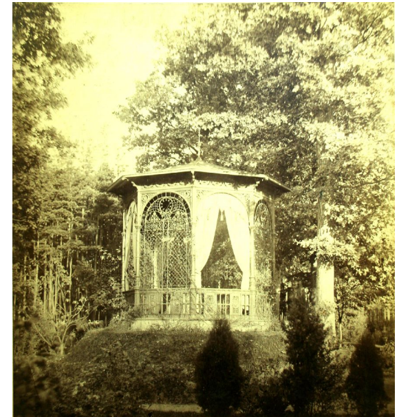
Ehemaliger gusseiserner Pavillon im Garten der Villa

Teile davon sind heute noch erkennbar und harren ihrer Wiederentdeckung. Heute befindet sich die Villa im Besitz der Katholischen Kirche, die das Anwesen in der Vergangenheit für Seminare nutzte.