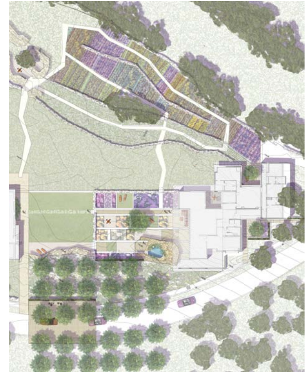
Entwurf: Campus Libanon