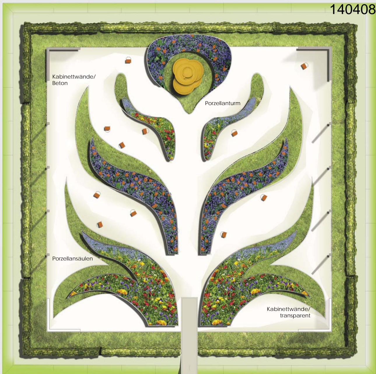
Porzellankabinett M 1:100