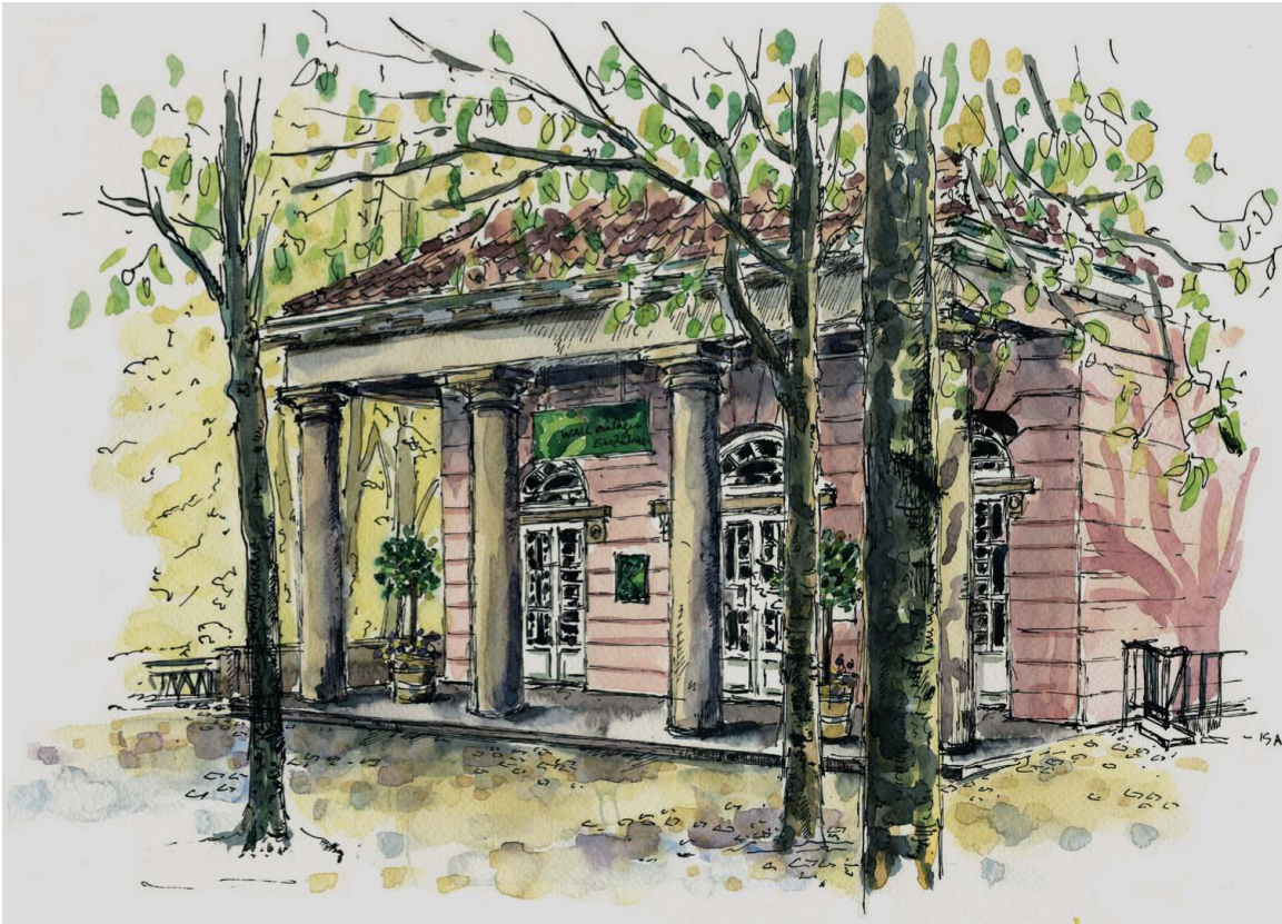
Ansgarii – Torhaus in den Bremer Wallanlagen (Aquarellzeichnung von der Bremer Künstlerin Isa Fischer 2023)

DGGL – INFO - CENTER , Bgm.-Smidt-Str. 88, 28195 Bremen